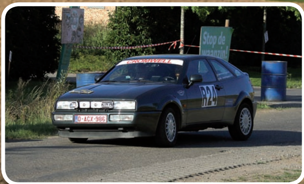
1 ste Algemeen Van den Wyngaert-Van den Wyngaert