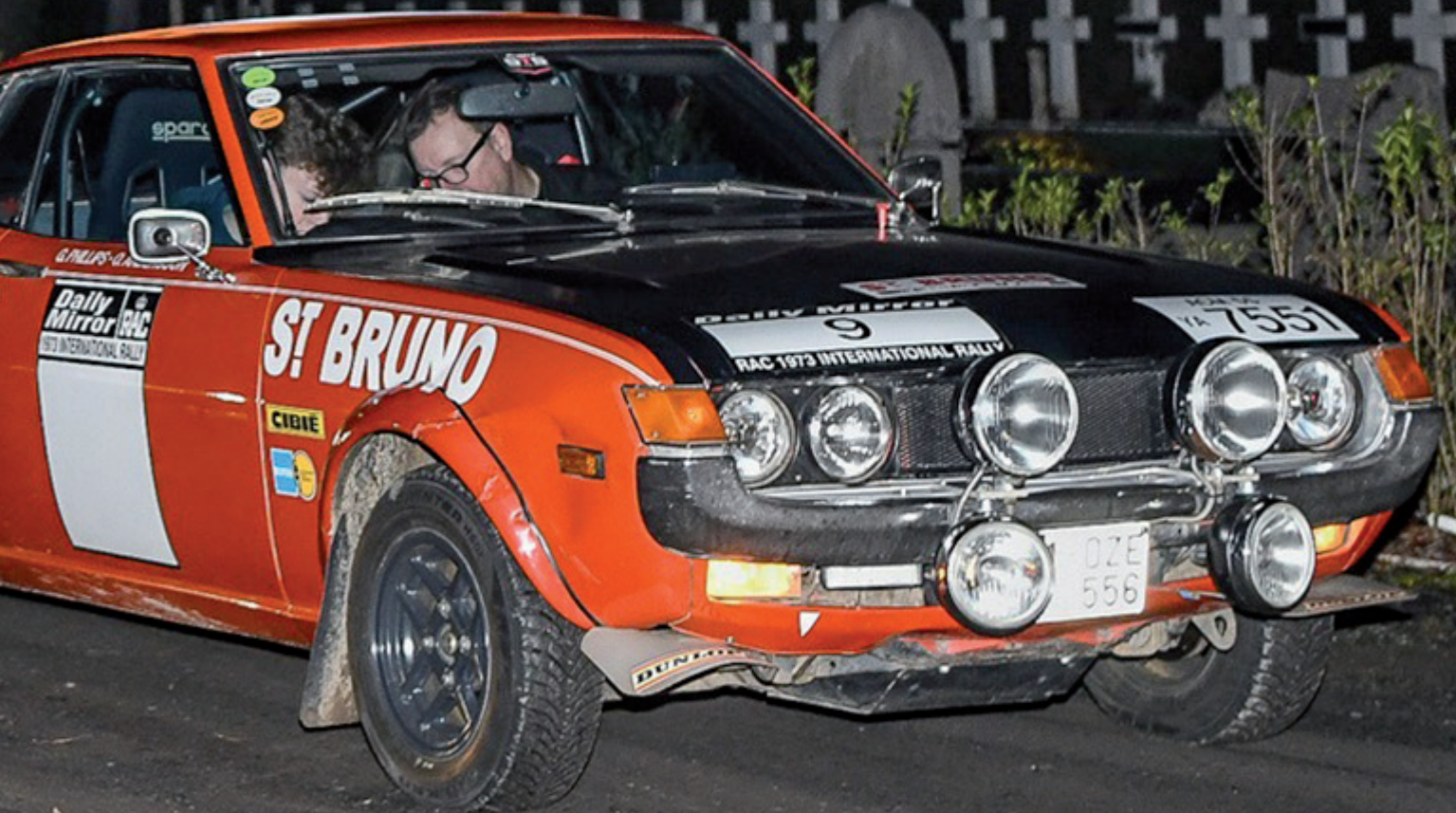
Fotografie Keyenberg Marc Vanparijs Ronny