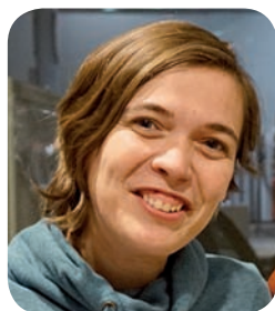
Peters Leen Slalom

Deze editie kwam tot stand dankzij de medewerking van onderstaande Vassers welke de resultaten van de diverse kampioenschappen voor hun rekening namen