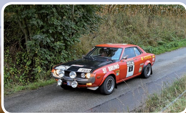
2de Algemeen De Bruyne-De Bruyne