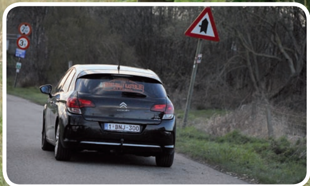
Touring De Cnodder-Huysmans