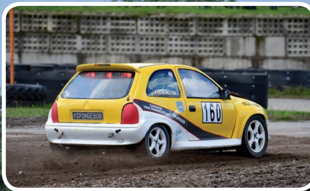
1 ste Klasse B Wilms Bob