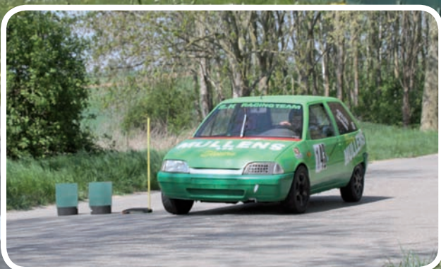
1 ste Divisie 4 Peters Jean-Marie