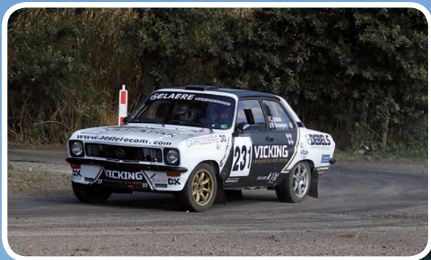
Divisie 4 Debue Claude