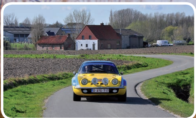
1ste Algemeen Vancraeynest-Desmet