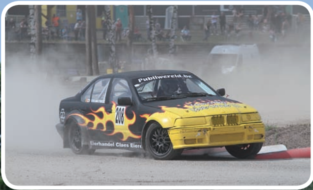
1 ste Klasse C Maeyninx Yorick