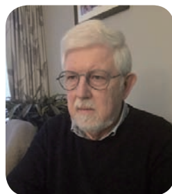
Rackham Leo Classic, Marathon, Regularity, Rittensport,