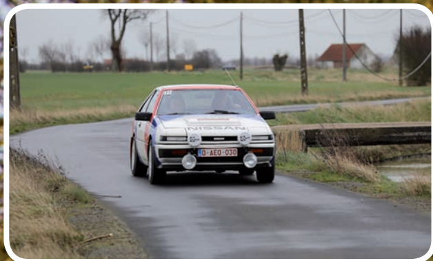
4de Algemeen Agten-Seynaeve