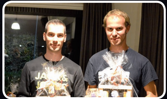
Touring De Cnodder-Huysmans