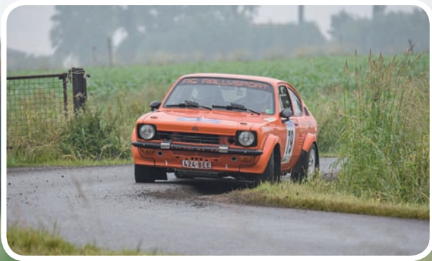
Kampioen Divisie 4 Rogiers-Denblyden