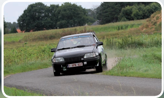
Kampioen Divisie 5 Lambert-Vanoverberghe