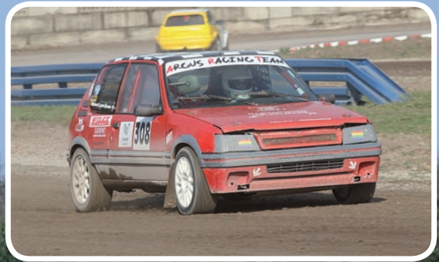
1 ste Klasse D Lauvrijsen Ruud