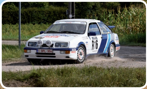
3 de Algemeen Meeus-Meeus