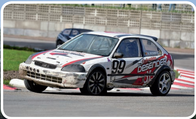
1 ste Klasse A Desender Ben