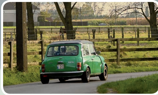
Oldtimer Smeets Eddy