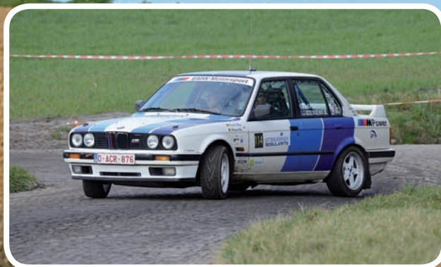
2 de Algemeen Stessens Bas