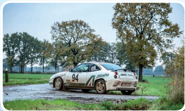
1 ste Youngtimer Aarts-Aarts