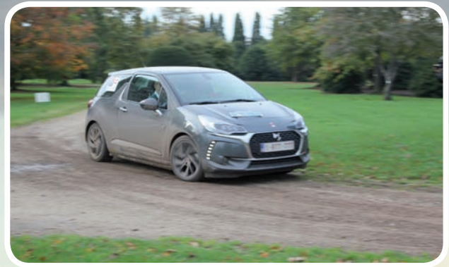
Tourtimer De Weerdt-Lauwers