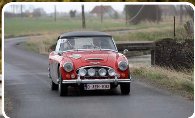
5de Algemeen Dupont-Dupont