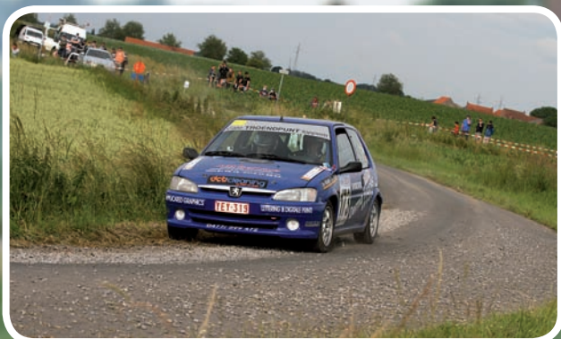
Kampioen Divisie 1-2 Diet-Van Dycke