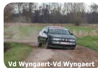
Vd Wyngaert-Vd Wyngaert