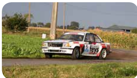
Lietaer-Vandewalle Divisie 4