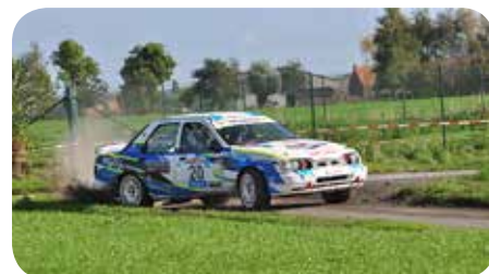
Toorré-Verschoore Divisie 5