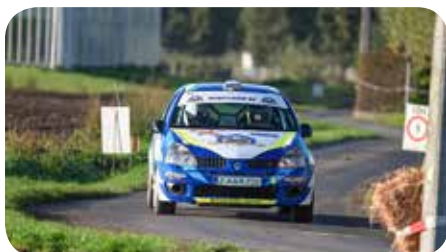
Lynneel-Seynaeve - Divisie 1-2