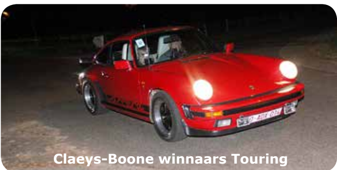
Claeys-Boone winnaars Touring