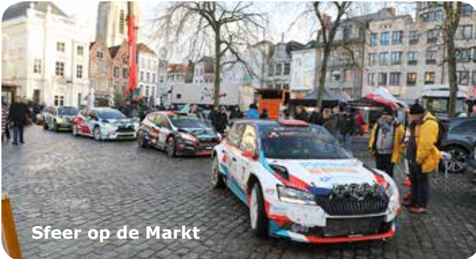
Sfeer op de Markt