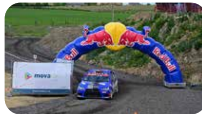
Becaert-Van de Walle