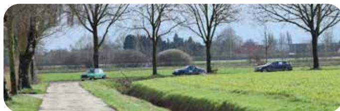
Triootje in 't groen